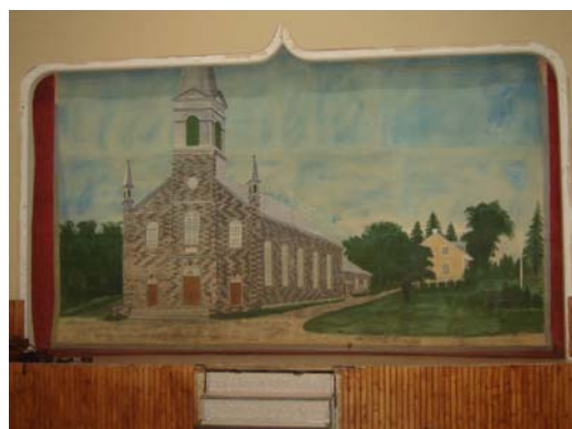
Toile ancienne d'un artiste inconnu Centre des loisirs Simonne-Simard Saint-Épiphanie