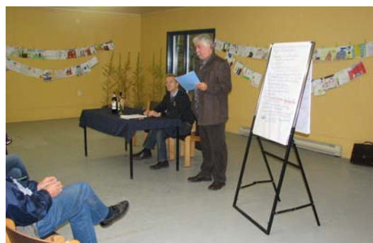
Colloque de développement de la municipalité de Saint-Modeste